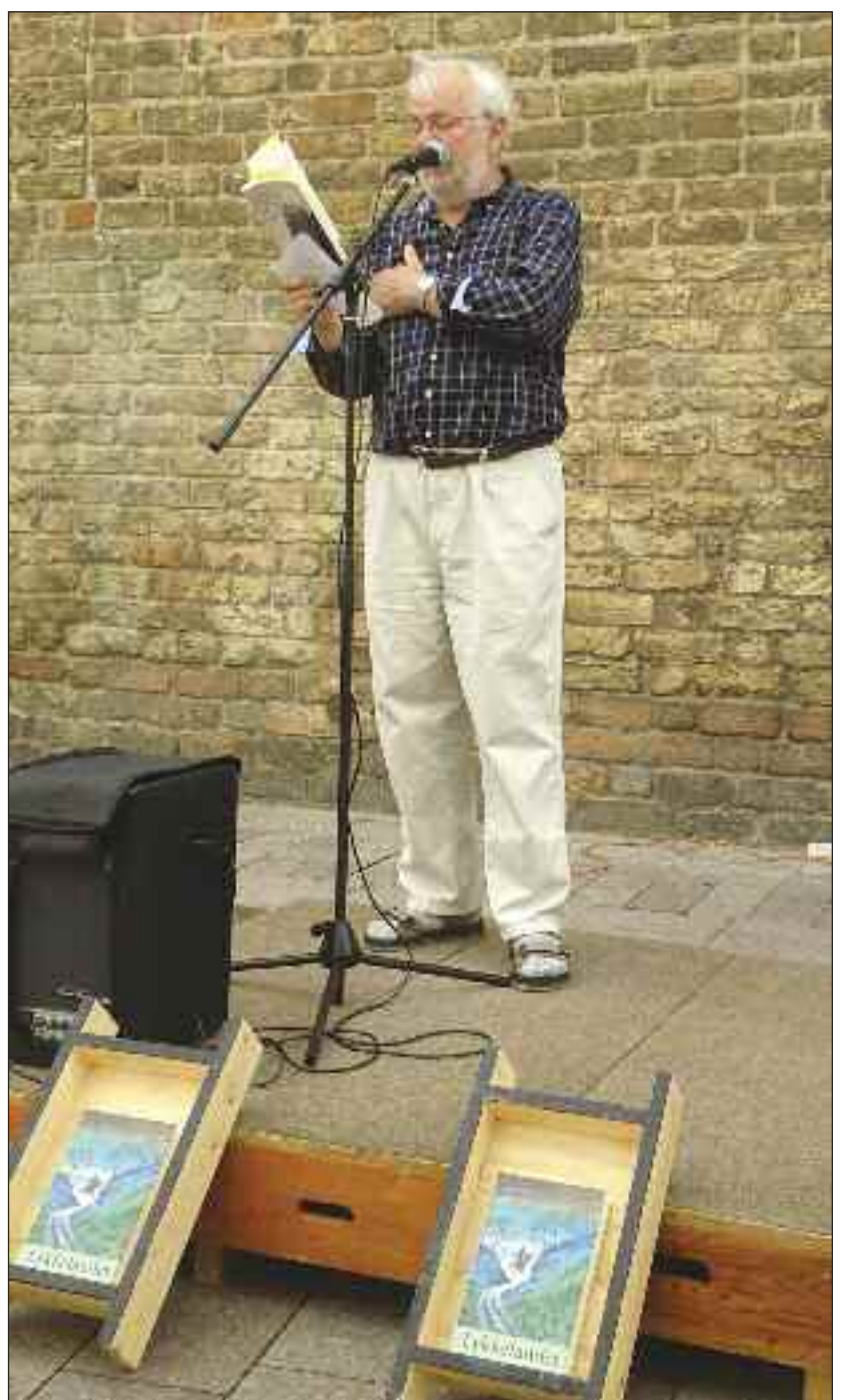
Forfatteren Rolf D. Erbst læser op.