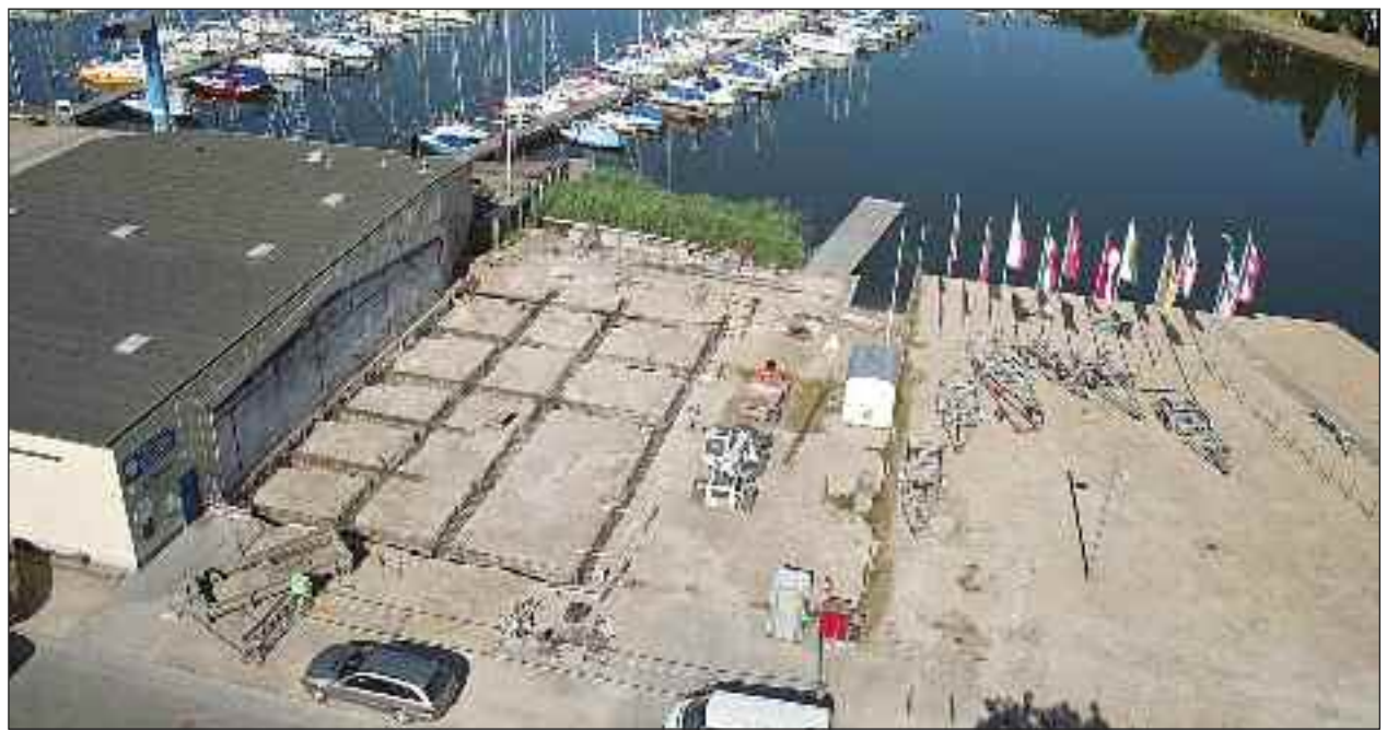
Byggepladsen fra oven.