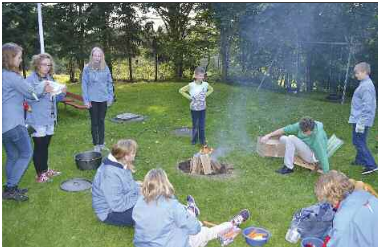
Bålet tændes.