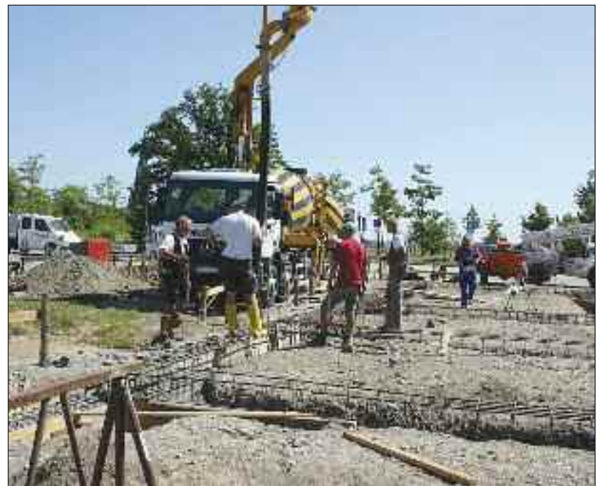
Betonstøbningen er påbegyndt.

Han minder medlemmerne om, at der trods byggeriet er aktivitet i klubben: »Vi ses i Mysunde eller på byggepladsen«.