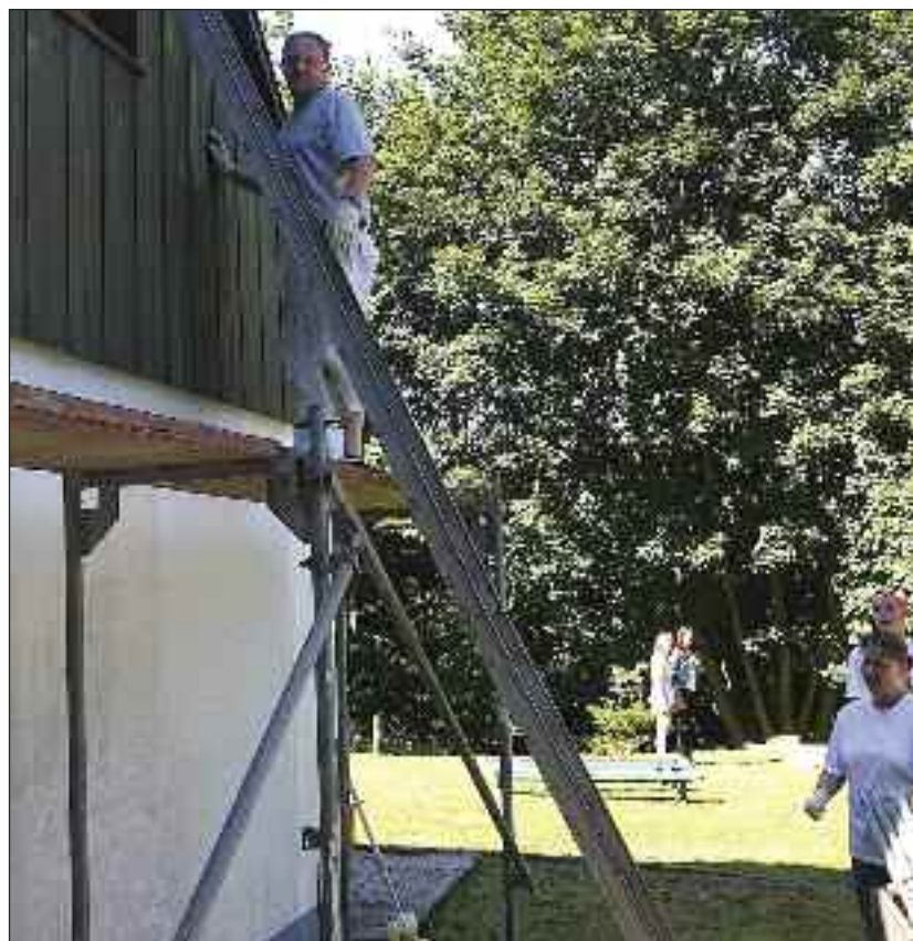
Fra arbejdsdagen sidste år i august, hvor bl.a. Ugleredens trægvale blev malet.