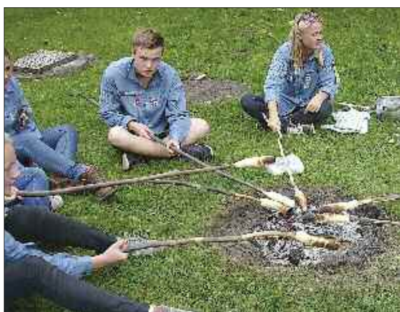
Bålsted + snobrød + hygge = FDF-møder.