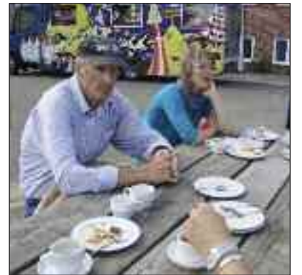
Også ude i skolegården hyggede de sig.

Næste cafédag er den 17. september. Kerstin Pauls