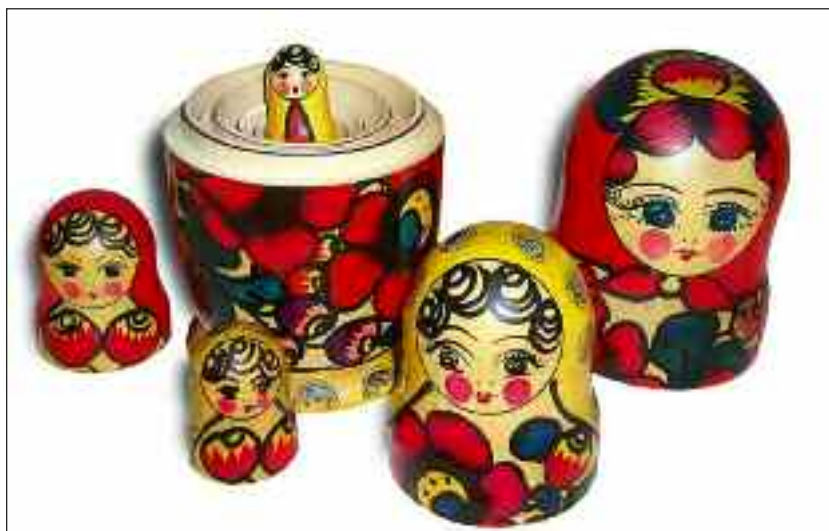
Typisk russisk: Matruska-dukkes.