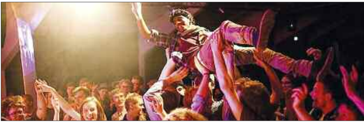
Stemningen er i top, når DoktorDoktor giver koncert.