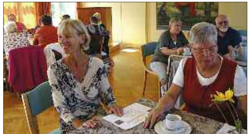
De hyggede sig inde.