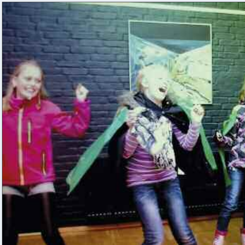
Friske unge på en tidligere SdU-efterårslejr.