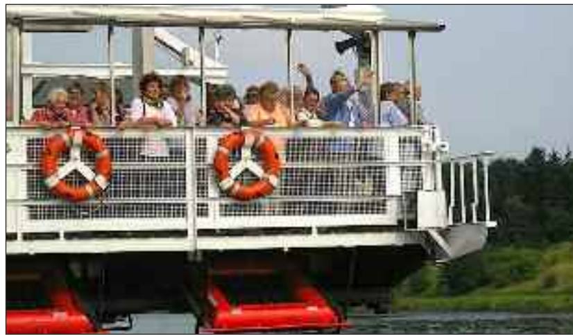
Vestkystens seniorer svævede over de sagte vande.