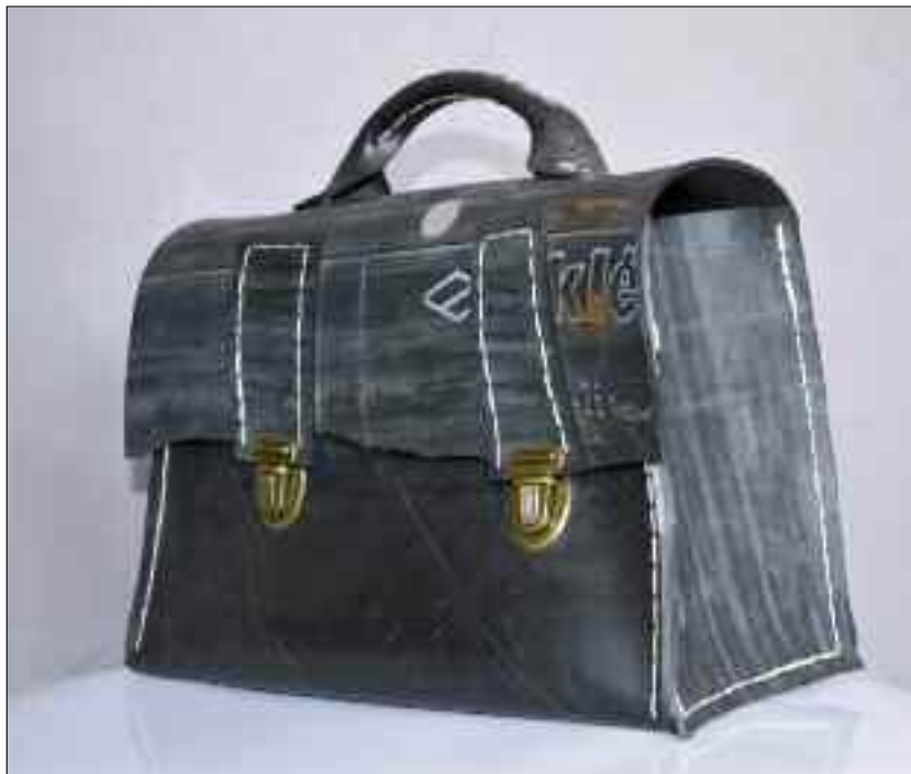
En taske af traktorslanger.

Tirsdag 27.8. kl. 17–19. Pris: Materiale efter forbrug – Ingen tilmelding.