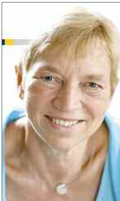
Europaminister Anke Spoorendonk.