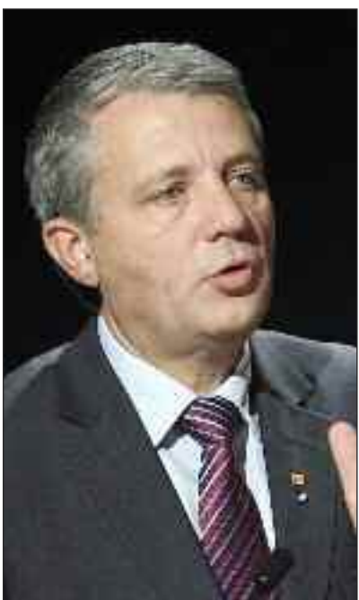
Generalsekretær Dagfinn Høybråten.