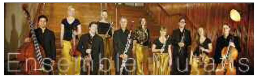
Ensemble Mutatis.