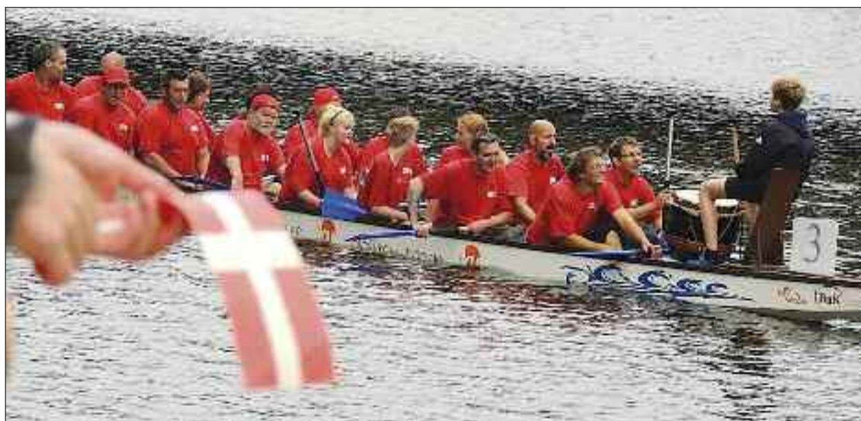
Kampgejst og holdånd fejlede intet i Danish Dynamite-dragebåden i weekenden i Frederiksstad.