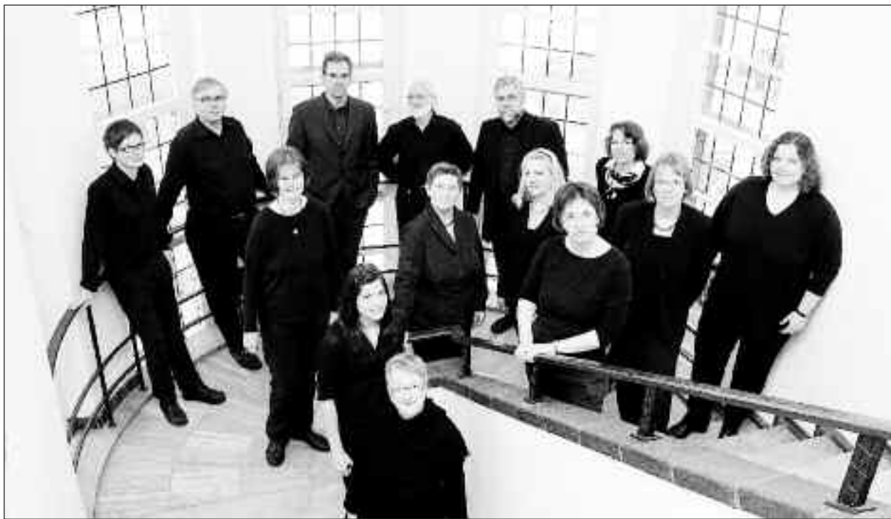
Kleiner Chor Husum.