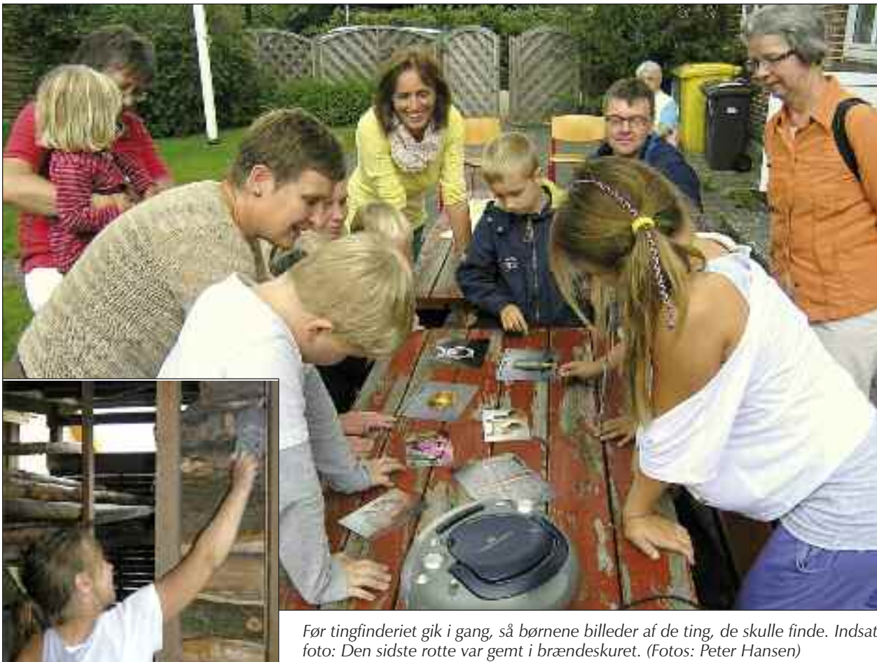
Før tingfinderiet gik i gang, så børnene billeder af de ting, de skulle finde. Indsat foto: Den sidste rotte var gemt i brændeskuret.