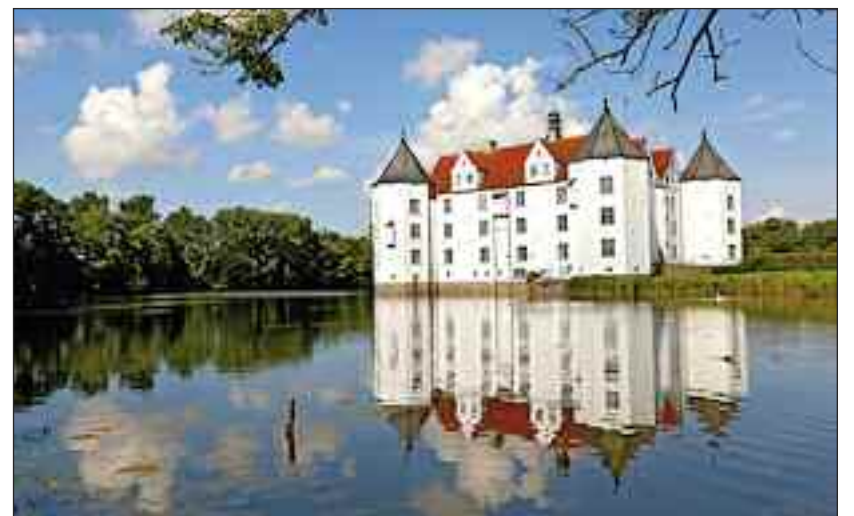
Lyksborg Slot.