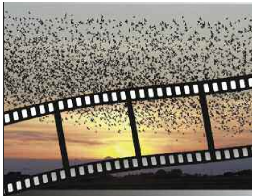
Sort sol.