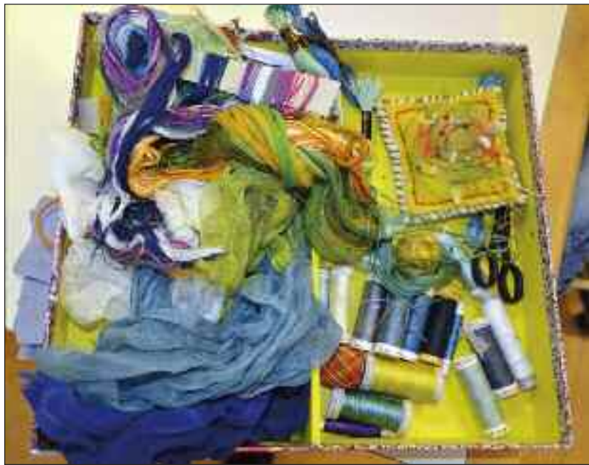
Der kan sysles med stort set alt materiale.