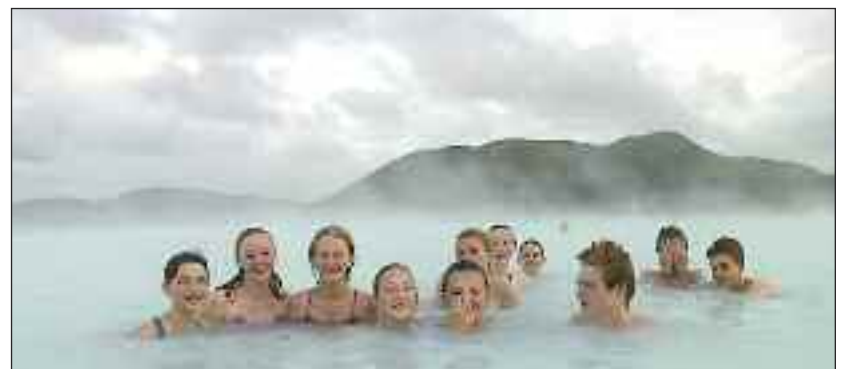
Fra efterårslejren 2011.