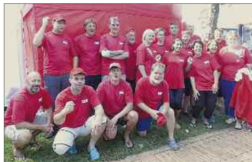
18 veloplagte mænd og kvinder fra 14 til 63 prøvede kræfter ved dragebådsregattaen.