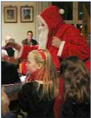
Julemanden kommer.