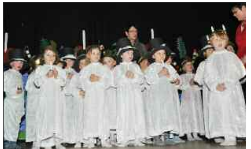
Lucia-holdet bestod af både piger og drenge.