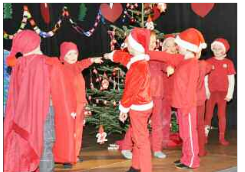
Nissernes optræden gjorde lykke.