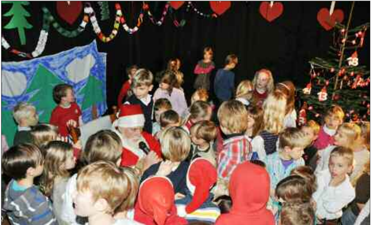
Midt i mylderet - julemanden.