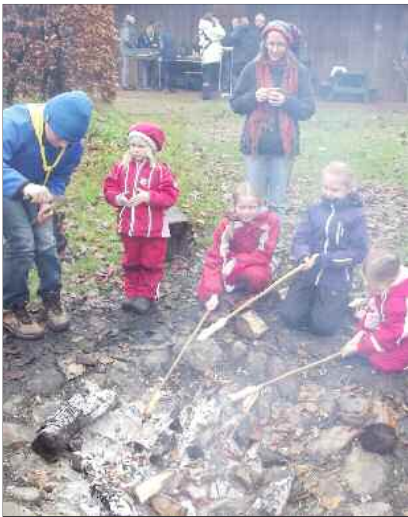
Udenfor spejderhytterne vankede snobrød, grillpølser og gløgg.

Sidste års succes blev overtruffet en anelse i år, og det vil attangørerne også søge at leve op til næste år.