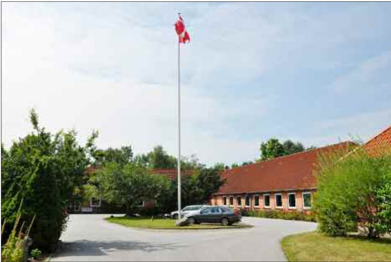
Jaruplund Højskole tilbyder til efteråret 2013 atter mindretals-introkurser for nye medlemmer af det danske mindretal.