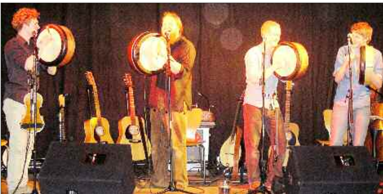
Fire mand på fire bodrhans. Jo, det går, når de fire hedder Nielsen og er Almost Irish. Det går endda rigtigt godt. Det er næsten som at høre Barney McKenna og John Sheahan duellere på strengene i deres velmagtsdage.