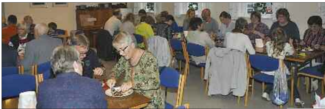
45 deltog i høstfesten på Paludanushuset efter gudstjenesten i kirken.