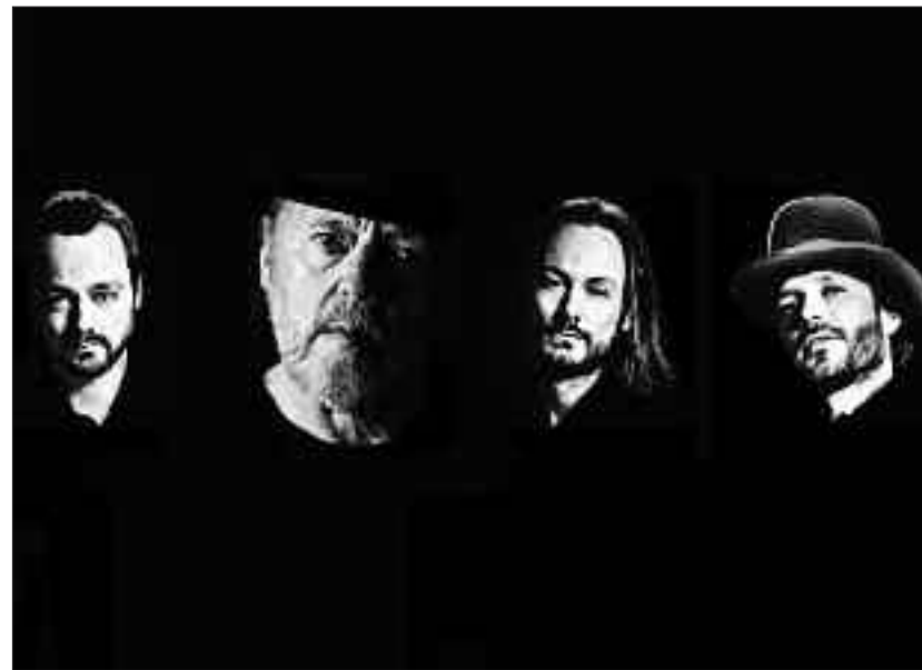
Dissing, Dissing, Las & Dissing.