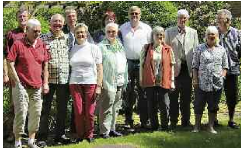
Guldkonfirmander til planlægning i juni. (Foto: privat)